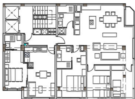
PLANTA TIPO (7º) Sup. construida 165.75 m 2