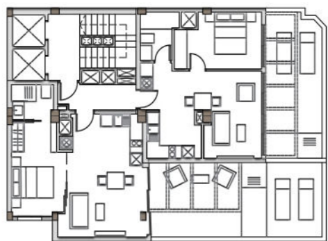
PLANTA ÁTICO (8º) Sup. construida 165.75 m 2