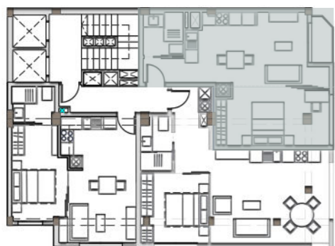
PLANTA TIPO (1º, 2º, 3º, 4º, 5º Y 6º) Sup. construida 165.75 m 2