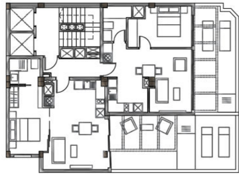
PLANTA ÁTICO (8º) Sup. construida 165.75 m 2