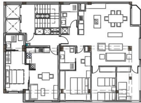
PLANTA TIPO (7º) Sup. construida 165.75 m 2