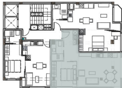
PLANTA TIPO (1º, 2º, 3º, 4º, 5º Y 6º) Sup. construida 165.75 m 2